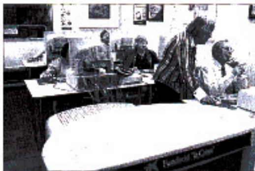
PROFESORAS. Las profesoras están pendientes de los alumnos.

Leer prensa, visitar museos, viajar por internet, buscar ofertas de viajes, o enviar correos electrónicos a amigos y familiares son algunos de los alicientes de los alumnos de la Ciberaula de repaso. «Chatar no me gusta demasiado. No tengo interés en conocer gente, ni en ligar. A mí lo que me gusta es aprender, estar al tanto de las cosas que pasan», confiesa una de las alumnas. Sus compañeras asienten con un gesto. Muchos de los asistentes no tenían ordenador,